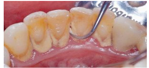
歯石をスケーラーという器具で除去しています

←写真のように歯石は歯と歯肉の境目に付着します。歯ブラシの毛先を考えながら磨いてください。