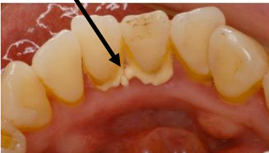
歯石が歯の根元に付着している

←写真のように歯石は歯と歯肉の境目に付着します。歯ブラシの毛先を考えながら磨いてください。